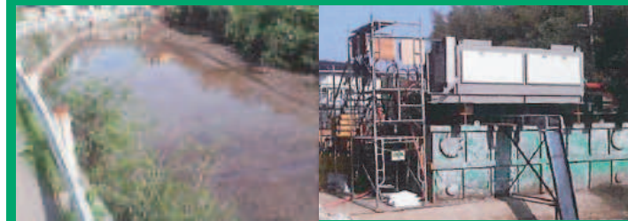
有害物・重金属処理

土木工事・排水処理における汚泥脱水・濁水処理に 仮設脱水機レンタル事業 (スクリュージェカンタ型遠心分離機) screw decanter centrifuge separator