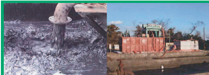
上下水・し尿処理場