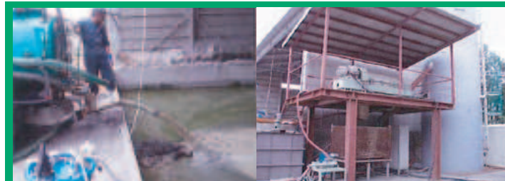
廃棄物処理および処理場