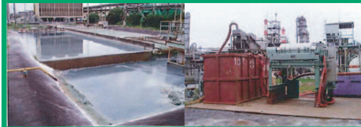
工場廃水・製造工程