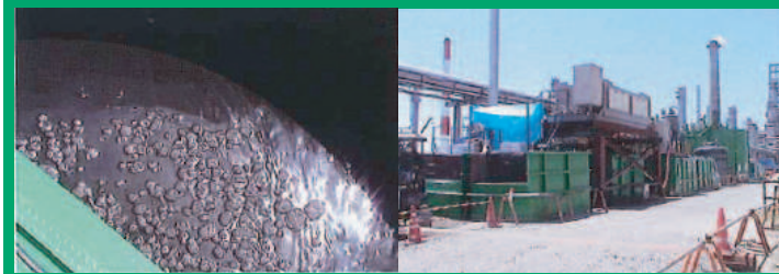
油分を含む泥水処理